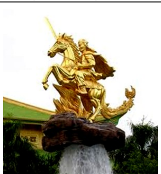
Tượng Lý Thường Kiệt

Ngày nay Đảng Cộng sản Việt Nam, kế thừa và phát huy truyền thống dân tộc, đã đề ra đường lối đoàn kết giai cấp, đoàn kết dân tộc và đoàn kết quốc tế, kết hợp sức mạnh dân tộc với sức mạnh thời đại.