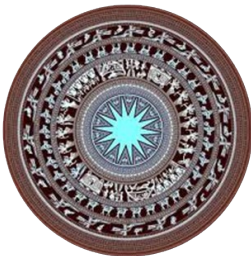
Mặt trống đồng Đông Sơn

Theo lịch sử và truyền thuyết, từ buổi đầu thời đại đồ đồng ở nước ta có khoảng 15 bộ tộc Lạc Việt định cư ở Bắc Bộ và Bắc Trung Bộ, chủ yếu là ở miền trung du và đồng bằng châu thổ sông Hồng, sông Mã. Các bộ tộc đó có chung vùng lãnh thổ và phương thức sản xuất, chung kiểu tổ chức xã hội, tiếng nói, tập quán và văn hóa tương đối giống nhau