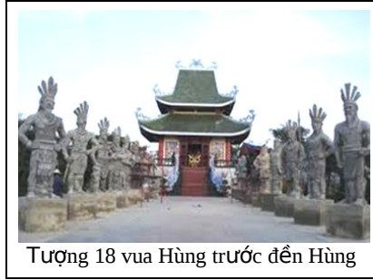
Tượng 18 vua Hùng trước đền Hùng

Sau 12 năm dẹp loạn 12 sứ quân năm 968, Đinh Bộ Lĩnh thống nhất quốc gia và xưng Vương, đặt tên nước là Đại Cồ