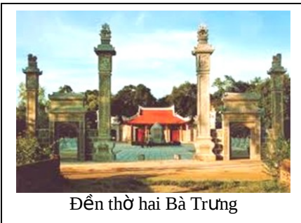
Đền thờ hai Bà Trưng

Đánh giặc giữ nước là một trong những truyền thống tiêu biểu của dân tộc Việt Nam. Từ truyền thuyết Thánh Gióng đánh giặc