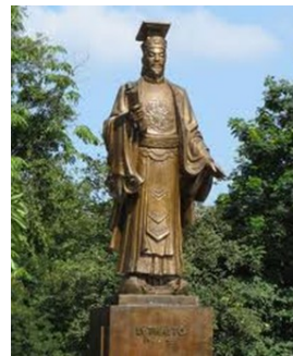
Tượng Lý Công Uẩn