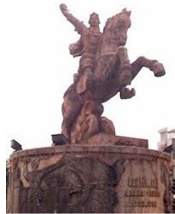
Tượng Quang Trung

Triều Nguyễn (1802-1945) là thời kỳ chế độ phong kiến chuyên chế tập trung khá hoàn thiện. Năm 1858, thực dân Pháp xâm lược nước ta, triều Nguyễn đã trở nên bảo thủ, không nắm được ngọn cờ dân tộc chống thực dân Pháp. Tháng 8 năm 1883, nhà Nguyễn ký Hiệp ước Hác Măng, sau đó đến tháng 6 năm 1884,