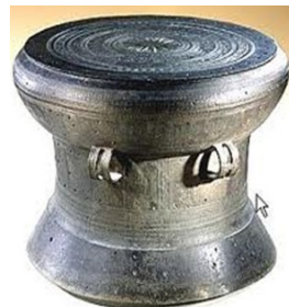
Trống đồng Đông Sơn

Theo lịch sử và truyền thuyết, từ buổi đầu thời đại đồ đồng ở nước ta có khoảng