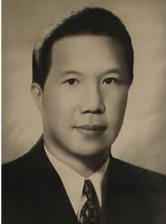
Vua Bảo Đại

Ngay từ khi thực dân Pháp xâm lược, nhân dân ta từ Nam chí Bắc đã liên tiếp đứng lên khởi nghĩa rất quyết liệt, với nhiều hình thức phong phú. Tiêu biểu là phong trào Cần Vương (1885-1896), khởi nghĩa Hoàng Hoa Thám (1915-1913), phong trào Đông Du (1904-1908), phong trào Duy Tân (1906-1908)... Mặc dầu các phong trào đó có tinh thần anh dũng rất cao, nhưng tất cả đều bị thực dân Pháp đàn áp và thất bại.