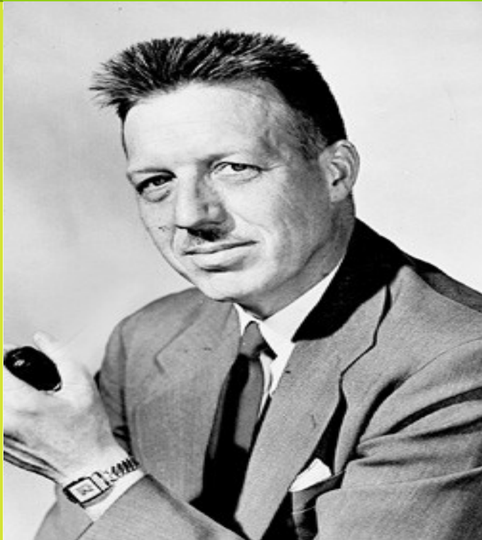
douglas mcgregor ( 1906–1964