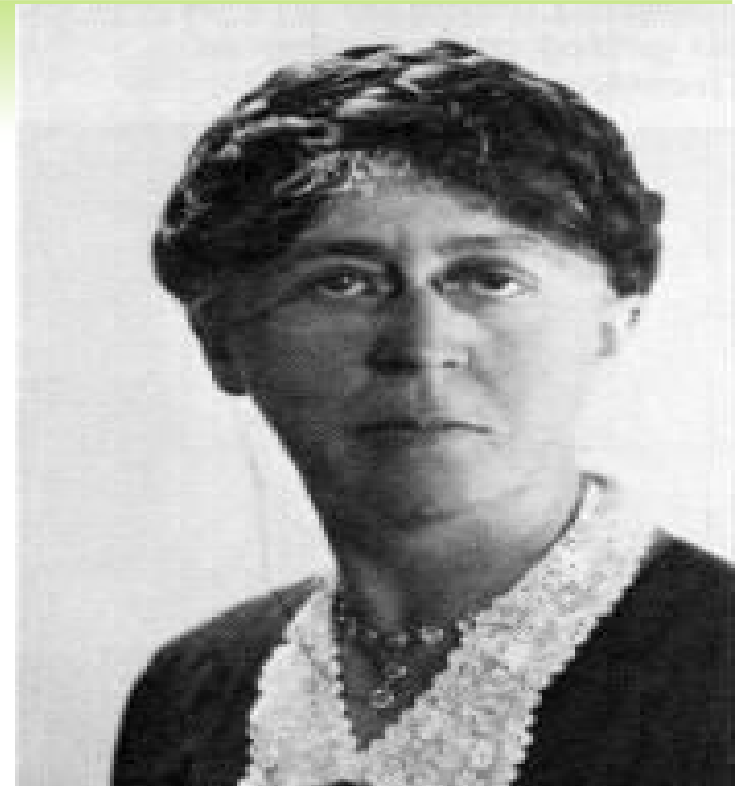
Mary Parker Follett (1868-1933)