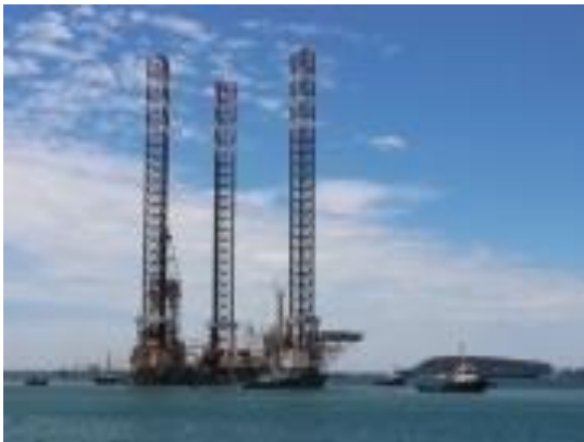
Hình 1.2 : Giàn khoan Murmanskaya

Đóng mới, sửa chữa tàu thủy, thiết bị và phương tiện nổi, chế tạo kết cấu thép các loại thiết bị nâng hạ (các loại cần cẩu), các thiết bị phục vụ Công nghệ chế tạo phương tiện thủy, phá dỡ tàu cũ, phục hồi máy móc thiết bị. Kinh doanh vật tư, thiết bị phụ tùng, phụ kiện, các loại hàng hóa có liên quan đến ngành Công nghiệp tàu thủy. Thiết kế mỹ thuật, thiết kế thi công công nghệ các loại phương tiện vận tải thủy, thiết bị máy móc lắp đặt trên tàu thủy. Sản xuất lắp đặt nguyên vật liệu, trang thiết bị nội thất tàu. Sản xuất các loại phụ tùng, phụ kiện thiết bị ngành Công nghiệp tàu thủy. Sản xuất các vật liệu, thiết bị cơ khí, điện, điện lạnh, điện tử phục vụ ngành Công nghiệp tàu thủy