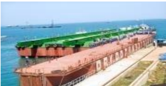
Hình 1.4 : Sàlan Vietsopetro