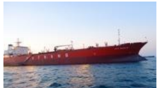
Hình 1.5 : QVTEagle