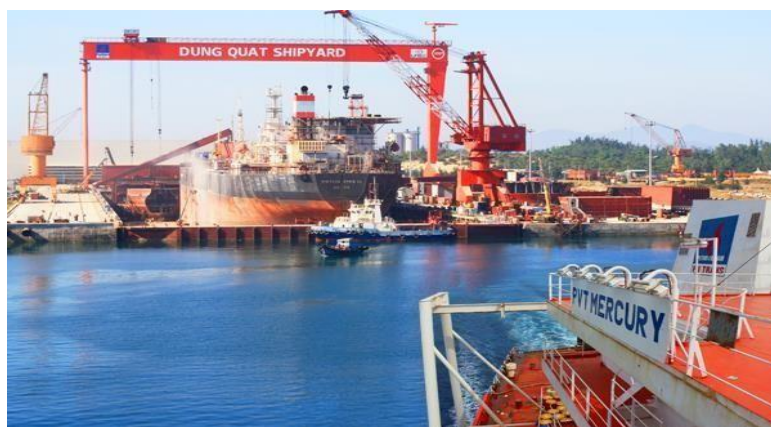
Hình 1.1: Công ty TNHH MTV Công nghiệp tàu thủy Dung Quất