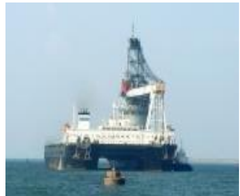
Hình 1.3 :Tàu cầu Trường Sa