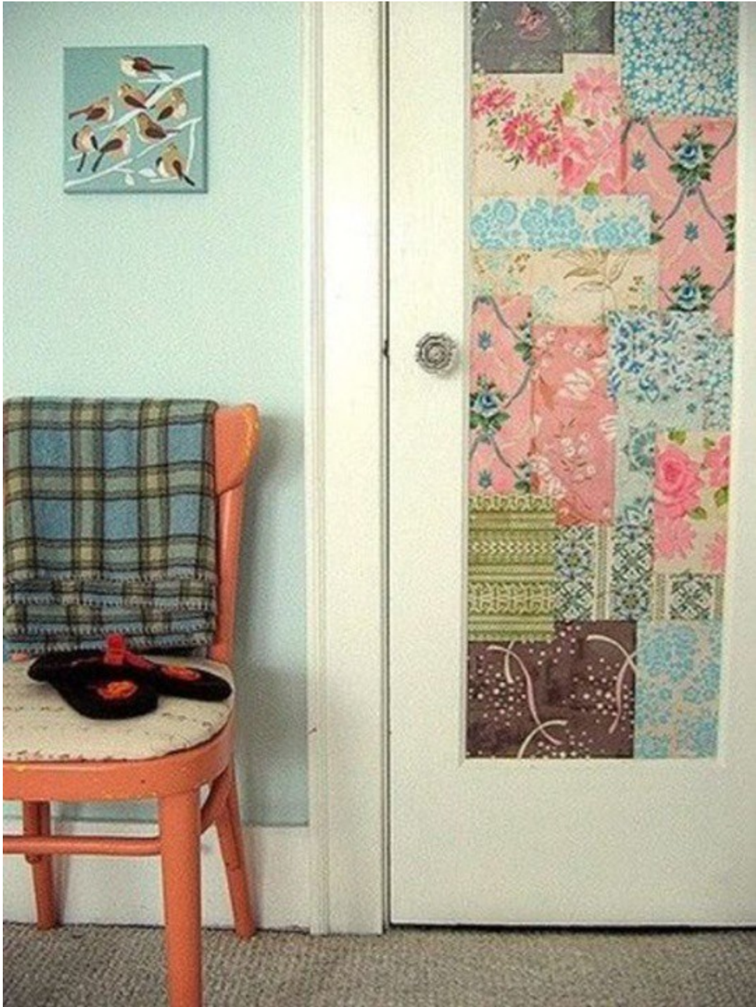
Cánh cửa này thì có phong cách vintage với những miếng giấy dán tường nhiều màu dán chồng lên nhau.