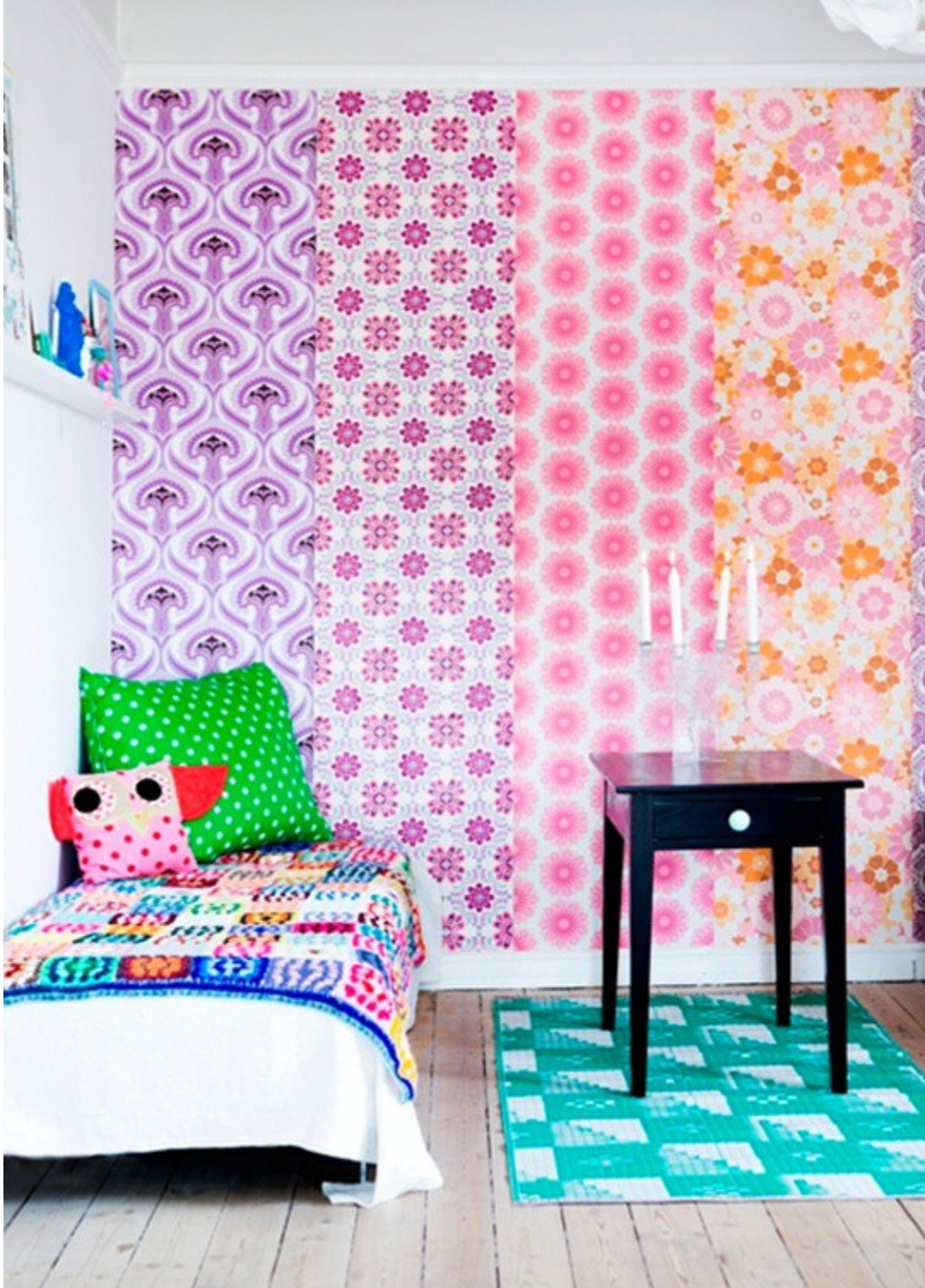
Bức tường với những sọc giấy xinh xắn và nổi bật.