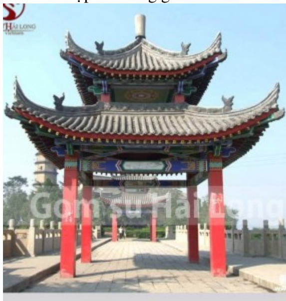
Mái nhà đẹp đình