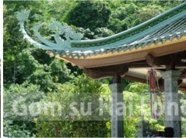
Mái nhà đẹp lâu hóng gió