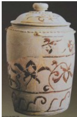
Bình gốm hoa nâu, trưng bày tại bảo tàng Lịch sử – Hà Nội.

Họa tiết hoa sen trên gốm hoa nâu thời Trần thường được chia thành ô hoặc thành băng để trang trí. Họa tiết ở đây cũng được dùng bút vẽ lên xương đất sau khi đã tráng men và kẻ vạch rồi mới đem nung. Để tài trang trí gốm nhiều loại mà trong đó họa tiết hoa sen chiếm số lượng lớn. Họa tiết hoa sen ở đây có loại đơn giản chỉ vẽ vạch mấy nét mà thành. Tuy nhiên phần lớn ở đây là loại hoa sen được vẽ theo lối nhìn nghiêng... Từ một cuống hoa ở dưới vươn lên rồi tiếp đến là các cánh hoa đổ ra hai phía bọc quanh một đài gương ở giữa. Hai cánh trên cùng đang ôm lấy gương sen, hai cánh tiếp đã nở vươn rộng ra hai bên và hai cánh dưới cùng thì đã đổ xuống phía dưới sắp tàn héo. Đơn giản như vậy nhưng vì các cánh sen ở đây không gò bó trong một khuôn mẫu đăng đối nào nên trông rất sinh động. Khi nhìn nhấn mạnh tạo một mảng đậm cho một cánh sen, lúc lại nâng cao lướt nhẹ mô tả một chi tiết của cuống hoa hay của búp sen. Mỗi ô một hoa, mỗi hoa một kiểu dáng, thường đứng riêng lẻ một mình hoặc kết hợp với một vài cây cỏ và búp sen. Đặc biệt có đồ án trên một tháp gốm thuộc Bảo tàng Hải Dương, nghệ nhân còn vẽ thêm nhiều búp sen và lá sen. Lá sen ở đây có nhiều kiểu dáng. Có lá bố cục theo lối nhìn chính diện từ trên xuống thành cả mảng tròn to thấy rõ cả chi tiết các gân lá. Có lá bố cục theo kiểu nhìn nghiêng viền của lá uốn lượn sóng. Có lá toàn bộ đã uốn cong xuống phía dưới báo hiệu sắp héo tàn... trông sinh động và hấp dẫn bởi bút pháp có xu hướng trở về hiện thực.