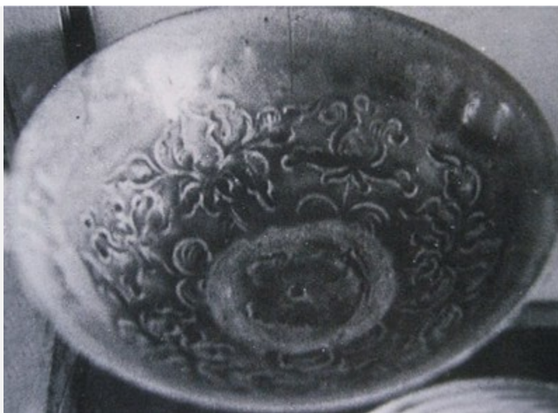
Bát men ngọc có họa tiết hoa sen, Bảo tàng lịch sử –Hà Nội

Họa tiết hoa sen trên men ngọc thời Lý được thể hiện bố cục theo lối nhìn nghiêng mặt trong của lòng bát (Bảo tàng Lịch sử Hà Nội). Cuống hoa quay vào tâm vòng tròn của lòng bát. Cứ một bông hoa sen lại một bông hoa cúc. Chúng được bố cục hoàn toàn độc lập với nhau. Tổng cộng mô típ có 3 hoa sen và 3 hoa cúc. Sen ở đây là nhiều cánh chưa nở, quây kín lấy gương sen và hai cánh ngoài cùng nở rộng ra 2 phía. Họa tiết sen ở đây được bố cục theo sự cân xứng, đăng đối từng hoa và toàn bộ đồ án và được khắc chìm vào xương đất, sau đó tráng men để đem nung. Đây cũng là đặc trưng kỹ thuật đồ gốm men ngọc thời Lý.