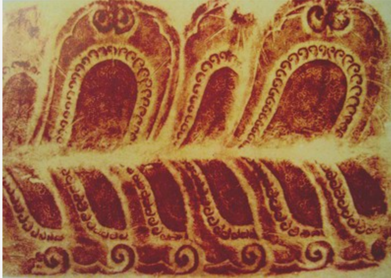
Sen cánh “đạo”, Bệ tháp Phổ Minh - Nam Định

3. Họa tiết hoa sen kết hợp hoa cúc của thời Lý mà nay còn thấy ở hai di tích chùa Long Đọi và tháp Chương Sơn .. Sắp xếp thay đổi cứ một hoa sen lại đến một hoa cúc trong những vòng tròn của hoa dây. Những vòng tròn này gần như tiếp tuyến nhau và chỗ gặp nhau là hình các thiên thần nhỏ bé đang trong động tác múa hoặc nhào lộn. Đồ án này cách điệu khá cao và có bố cục rất đẹp.