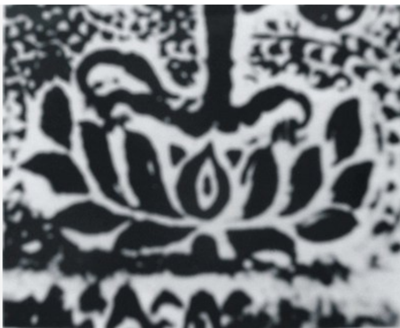
Hoa sen đỡ chân Phượng, Chùa Bà Tấm, Gia lâm - Hà Nội

Thời Lý họa tiết này thường đỡ chân chim phượng, trong các đồ án phượng múa ở các thành bậc chùa Bà Tấm, chùa Lạng hoặc phượng châu ở trán bia chùa Diên Phúc (Hưng Yên). Các vật thiêng có hình lá đề trong các đồ án về dàn nhạc các tiên nữ, và rồng châu ở chùa Phật Tích và chùa Chương Sơn v.v...Họa tiết này được thể hiện theo lối nhìn nghiêng, tức là hoa sen được bố dọc nên tạo thành một đài sen dẹt, gồm hai lớp với nhiều cánh, xuất phát từ giữa và choãi dần dần ra hai bên. Lớp trên thể hiện các cánh mới nở ôm lấy đài gương khuất ở trong. Lớp dưới là các cánh sen đã tàn, đổ dài ra hai bên.