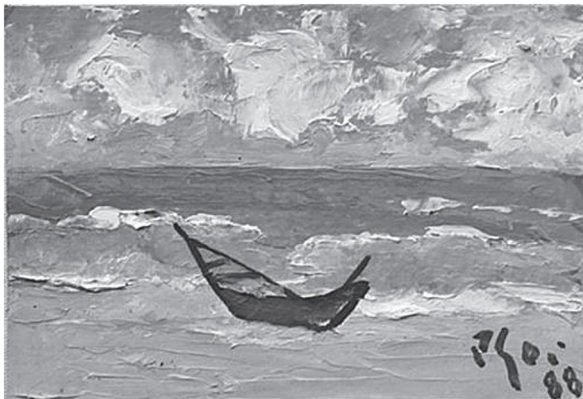
Hình 6. Bùi Xuân Phái, Biển Đà Nẵng, sơn dầu (1988)