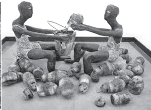
Hình 2. Kù Kao Khái, Chuyện quê (2013), tác phẩm sắp đặt, chất liệu tổng hợp