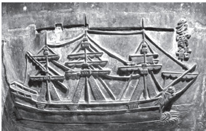
Hình 1. Tác giả dân gian Thuyền khắc trên Cao Đình ở Đại Nội - Huế