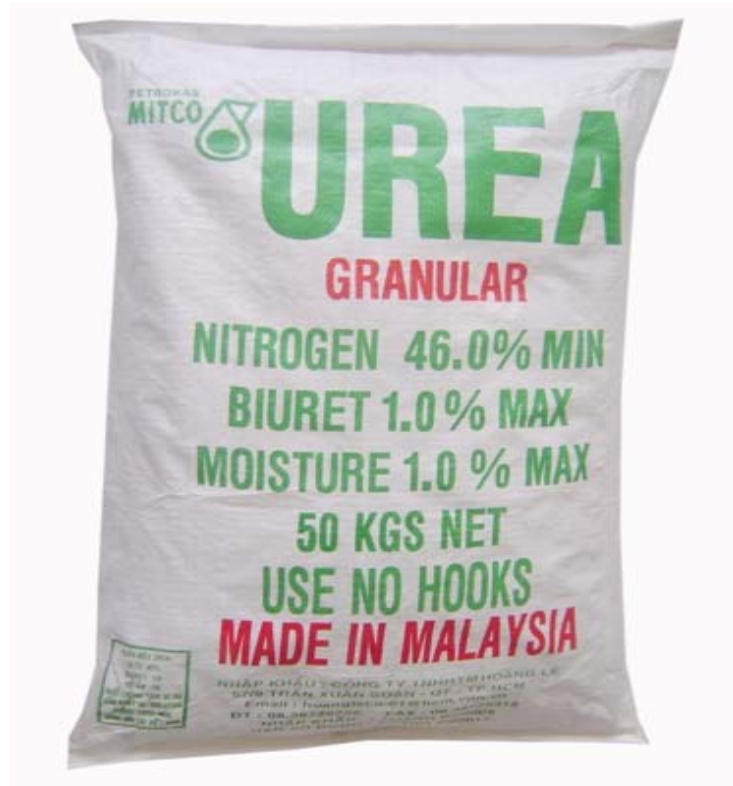
Hình 1.12. Phân đạm ure Malaysia

Thành phần dinh dưỡng chính Đạm (N): 46% tối thiểu, Biuret: 1% tối đa, độ ẩm: 0,5% tối đa. Kích cỡ hạt: 2 – 4mm tối thiểu. Hạt có màu trắng đục, dùng làm phân bón gốc cho các loại cây trồng. Khối lượng tịnh: 50 kg. Sản xuất tại Malaysia , hàng được đóng gói bên trong bao PE, bên ngoài bao PP.