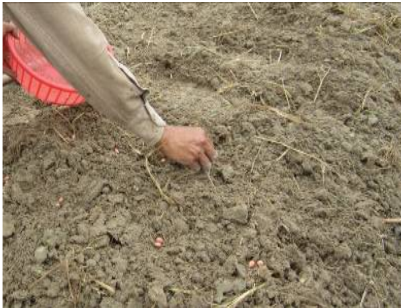
Hình 1.17. Gieo hạt lạc theo hàng theo hốc

Cày bừa làm đất tơi xốp nhất sạch cỏ dại, tiến hành lên luống theo kích thước đã quy định, sau đó rạch hàng hay bở hốc theo mật độ, khoảng cách định trước, rồi bón lót phân chuồng, phân lân lấp một lớp đất mỏng kín phân song gieo hạt theo hàng hoặc hốc sau đó lấp kín hạt độ dày lớp hạt 4 – 6cm tùy theo độ ẩm của đất và thời vụ gieo trồng.