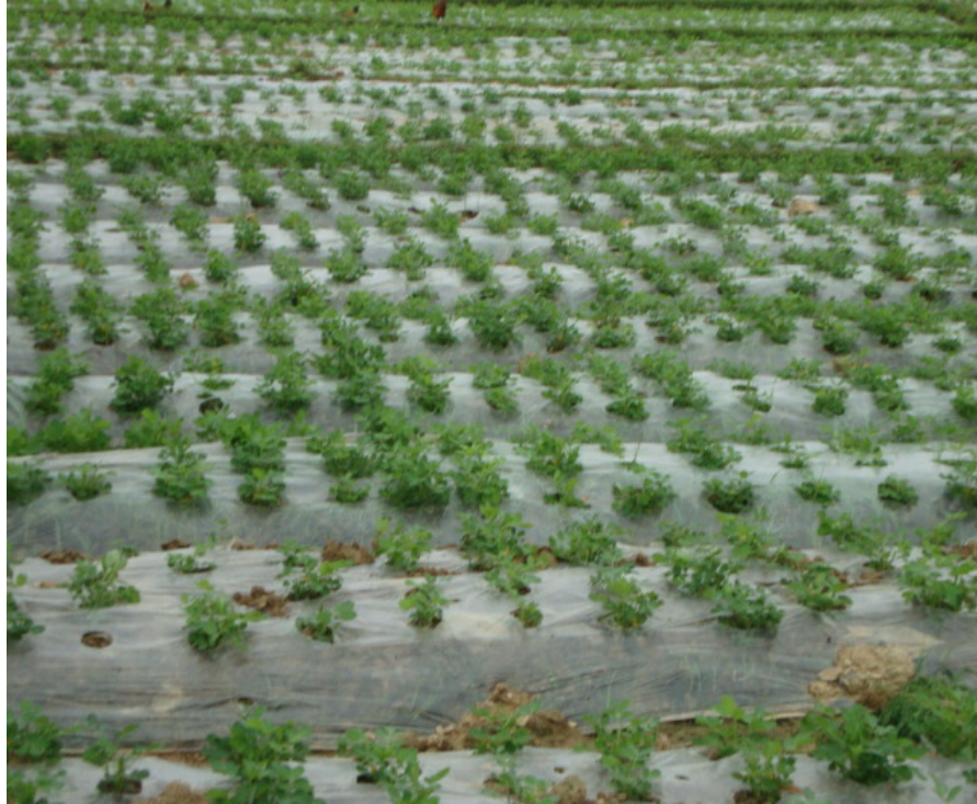
Hình 1.22: Trồng lạc bằng phương pháp che phủ nilon

phẳng, lần thứ hai bón 50% lượng còn lại khi cây lạc bắt hoa, có thể bón trực tiếp vào gốc hoặc rắc lên cây.