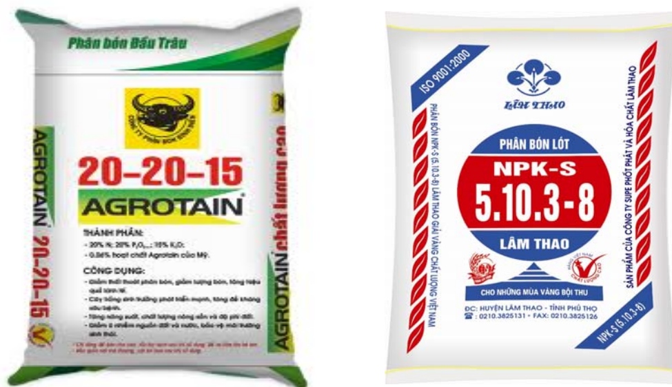
Hình 1. 19.: Phân NPK- S: 5.10.3 -8

Hiện nay trên thị trường các loại phân bón rất đa dạng vì thế việc lựa chọn phân bón loại nào? Hãng sản xuất nào? Đang là bài toán khó cho bà con nông dân. Tuy nhiên theo kinh nghiệm cho thấy các hãng (nhà máy) sản xuất phân bón có uy tín hiện nay vẫn đang khẳng định thương hiệu của mình như nhà máy sản xuất phân bón Bình Điền, Phú Mỹ... ở Miền Nam thì Miền Bắc có nhà máy supe Lâm Thao sản xuất phân bón trong đó có phân bón hỗn hợp NPK 5.10.3 -8 chuyên dùng bón lót cho các loại cây trồng trong đó có cây đậu tương và lạc.