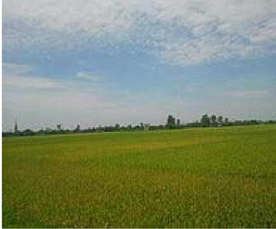
Hình 1.4. Vùng đồng bằng Sông Hồng

Vùng có khí hậu nhiệt đới và cận nhiệt đới gió mùa. Nhiệt độ trung bình năm khoảng 22,5 - 23,5 0 C. Lượng mưa trung bình năm là 1400 - 2000mm. Tuy nhiên, do nằm trong vùng khí hậu nhiệt đới gió mùa nên thường xuyên chịu ảnh hưởng của thiên tai như bão, lũ lụt, hạn hán.