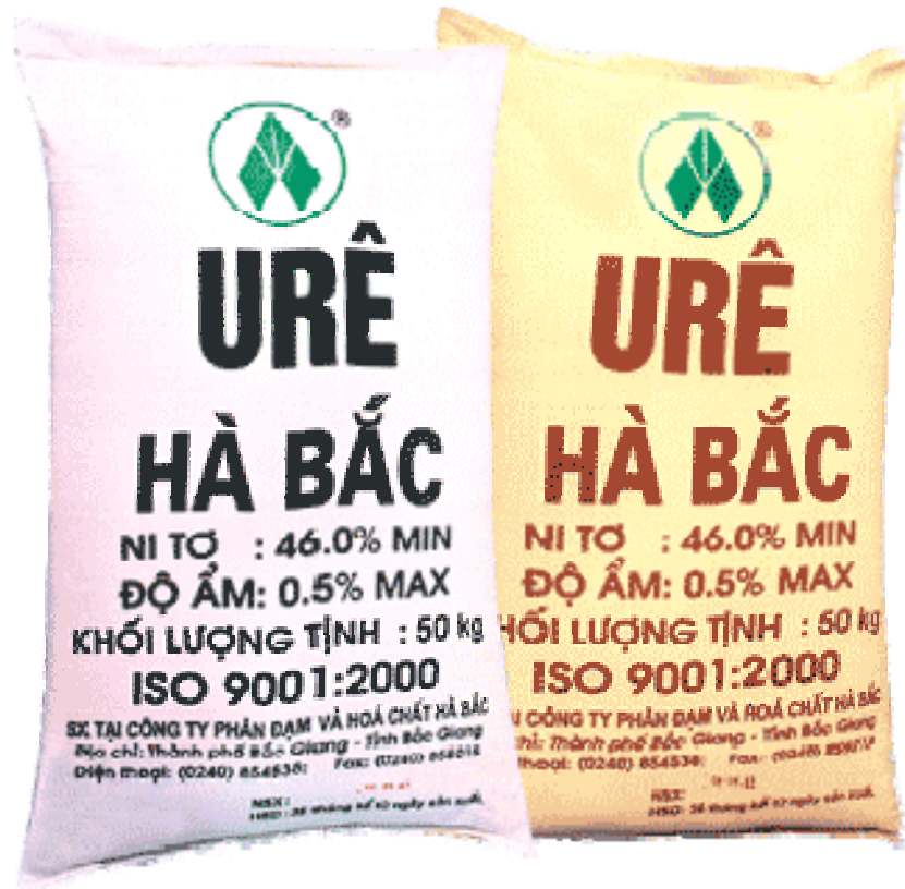
Hình 1.9. Phân dạm ure Hà Bắc

Khi bị amôn hoá tạm thời làm cho đất kiềm đi. Quá trình amôn hoá phụ thuộc vào tính chất đất, hàm lượng chất hữu cơ trong đất, pH đất và nhiệt độ