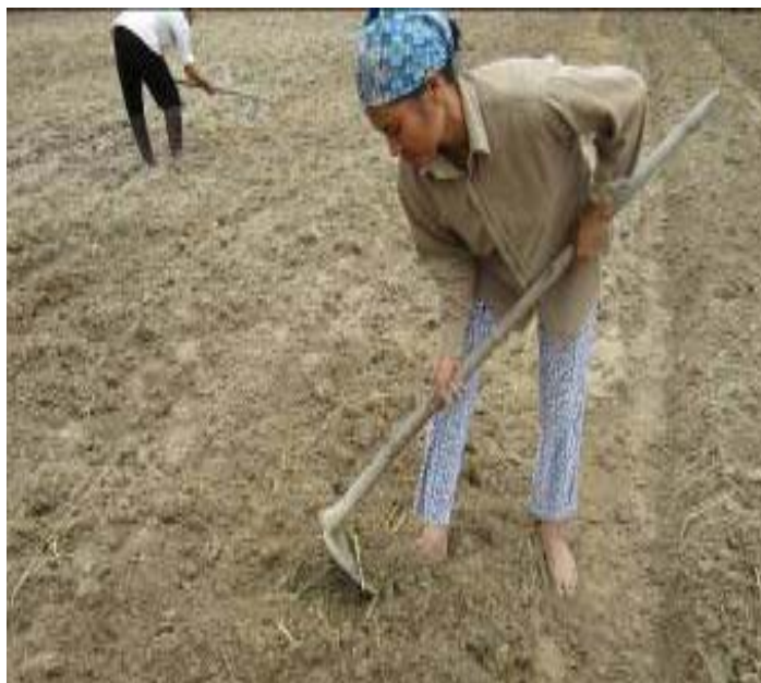
Hình 1.1: Lên luống trồng đậu tương

Bề mặt luống rộng 1,2 m, rãnh rộng 30 - 40 cm, sâu 20 - 25 cm. Dùng đòn gánh hoặc thanh gỗ nặng hình tam giác chêm ngang luống hoặc dùng cuốc tạo thành rạch ngang sâu 2 - 3 cm, rạch cách nhau 30 cm. Tra hạt theo hốc 2 - 3 hạt với khoảng cách hốc cách hốc 7 - 12 cm. Dùng số hạt thừa khoảng 100 gr, nên gieo thêm 1 m 2 mạ ở đầu bờ để dặm sau 5 - 7 ngày khi gieo (khi cây con chưa có lá thật) dặm vào các chỗ khuyết mật độ.