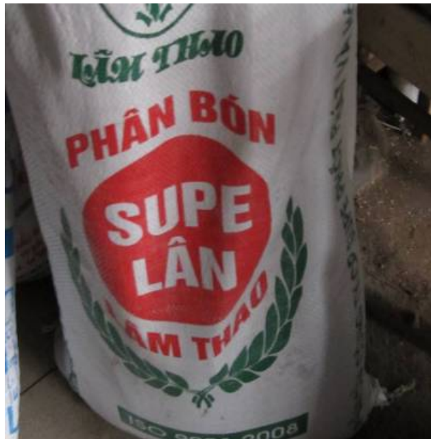
Hình 1.13. Phân super lân

Có phản ứng chua. Supe lân ít hút ẩm, nhưng nếu cất giữ không cẩn thận vẫn có thể bị vón cục, hoặc bị nhão.