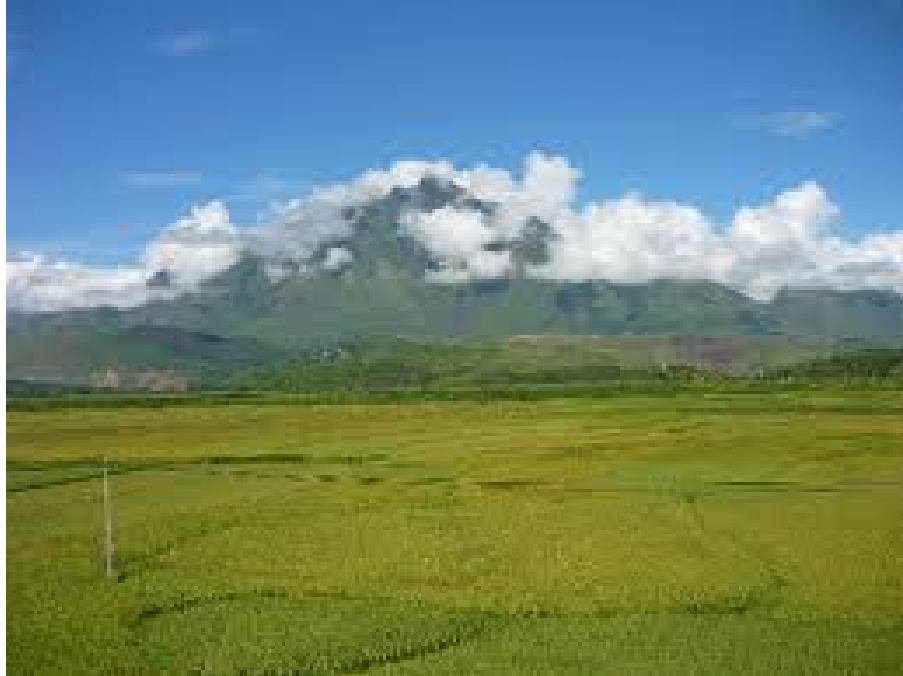
Hình 1.2. Vùng Việt Bắc Hoàng Liên Sơn

Miền khí hậu phía Bắc bao gồm phần lãnh thổ phía Bắc dãy Hoàng Sơn. Miền này có khí hậu nhiệt đới gió mùa với bốn mùa xuân, hè, thu, đông rõ rệt. Vùng này có đặc điểm địa hình tương đối bằng phẳng và thấp.