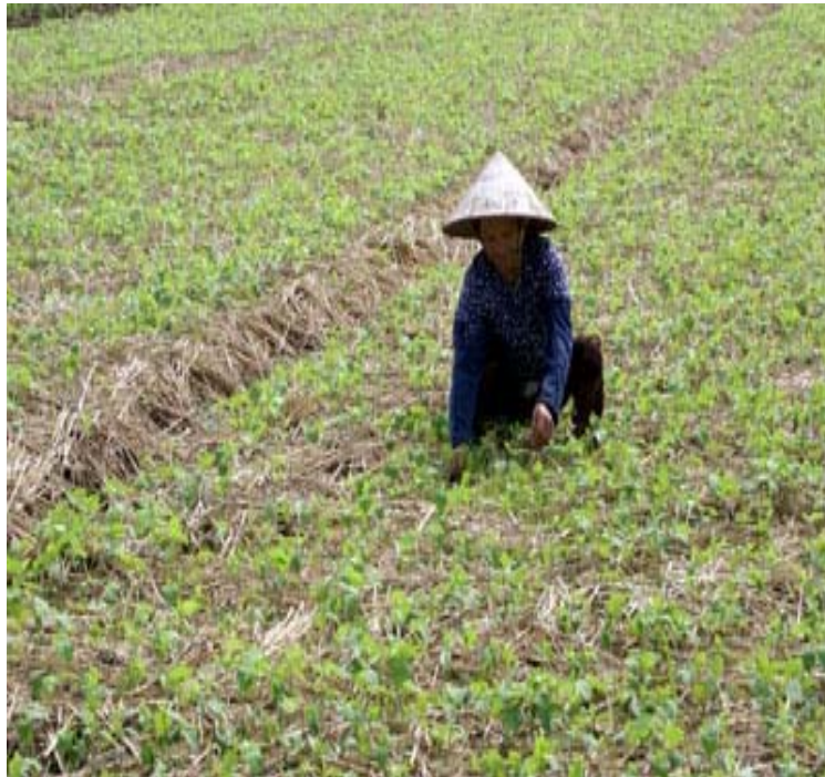
Hình 1.4: Chăm sóc cho đậu tương gieo vãi