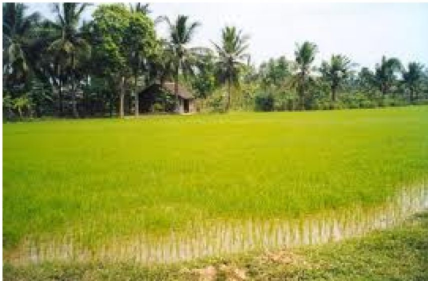
Hình 1.9. Vùng đồng bằng sông Cửu Long