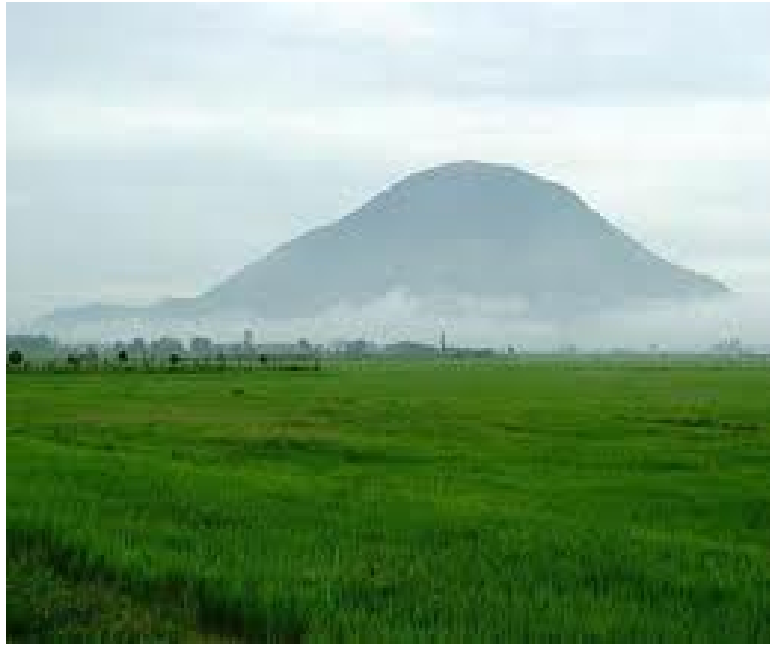
Hình 1.8 . Vùng đông nam Bộ

đạo có nền nhiệt ẩm phong phú, ánh nắng dồi dào, thời gian bức xạ dài, nhiệt độ và tổng tích ôn cao, biên độ nhiệt ngày đêm giữa các tháng trong năm thấp.