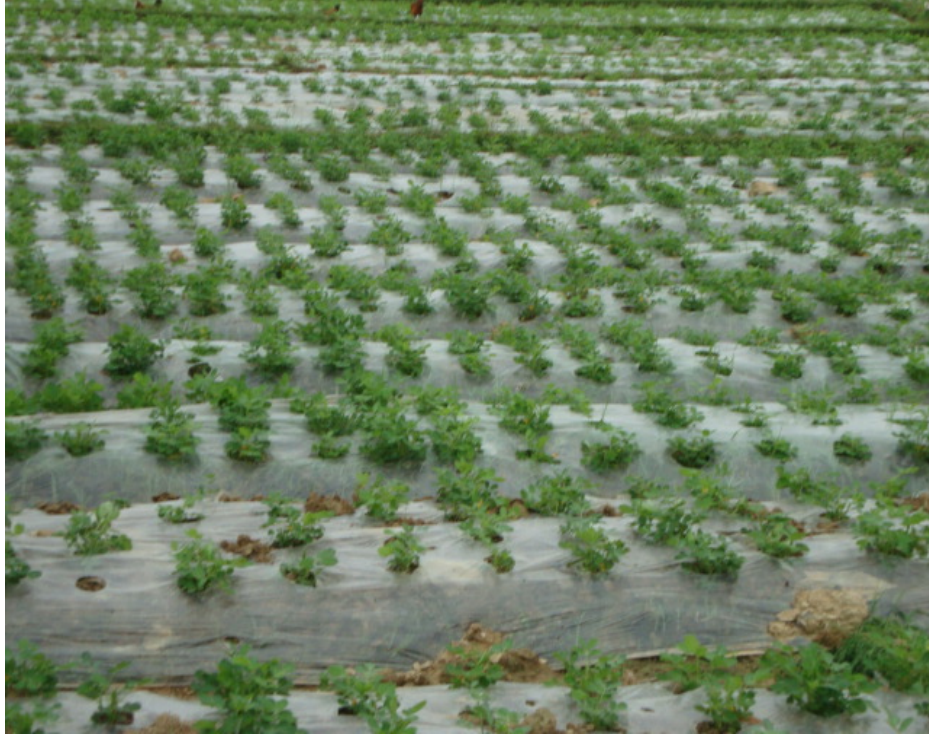
Hình 1. 8 . Mô hình trồng lạc bằng che phủ nilon