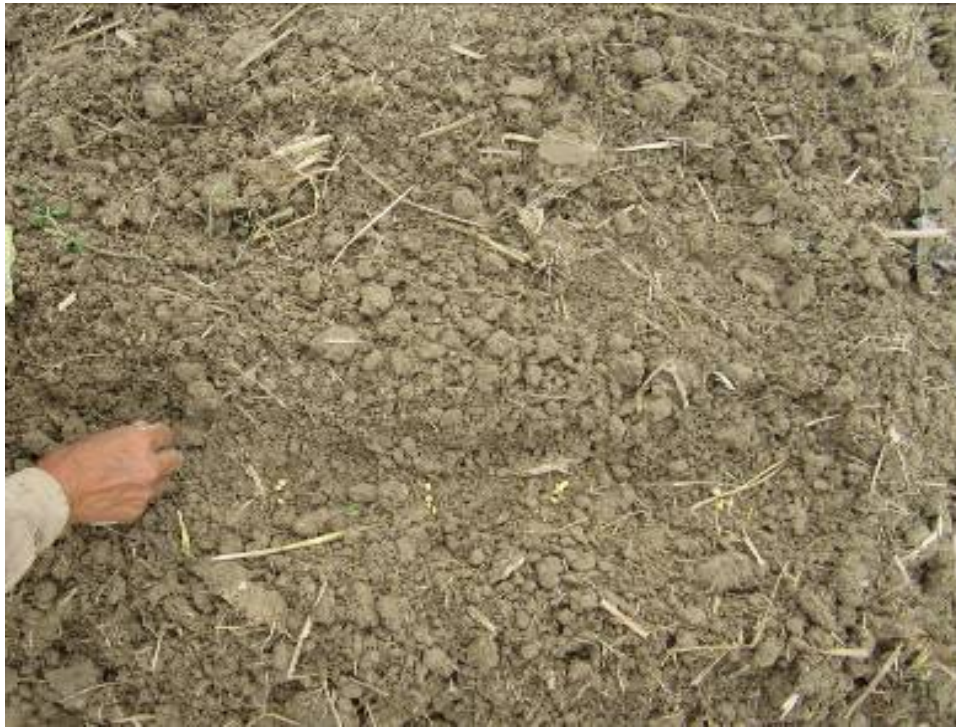
Hình 1.16. Gieo hạt đậu tương theo hàng theo hốc