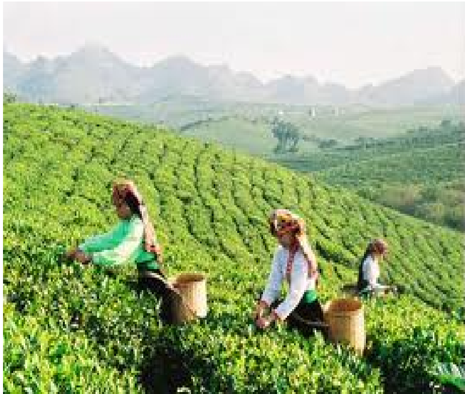
Hình 1.3. Vùng Đông Bắc

Các vùng ở đuôi các dãy núi cánh cung cũng rất lạnh do gió, mùa đông rét đậm hơn, khu vực núi cao thường xảy ra sương muối, băng giá nhưng mùa hè mát mẻ hơn, mưa nhiều hơn, độ ẩm cao hơn.... Một số tỉnh còn chịu ảnh hưởng của bão. Hệ sinh thái nông nghiệp chính là cây ăn quả nhiệt đới, á nhiệt đới, cây dược liệu và nuôi trồng thủy sản.