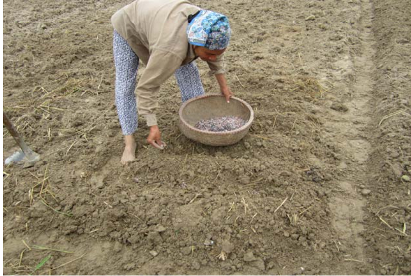
Hình 1.14 : Bón lót phân theo hàng, hốc

- Bón phân kali ( K_2O ) cho lạc phát huy tác dụng tốt trên các loại đất bạc màu, đất nghèo dinh dưỡng. Dạng kali sulphat hay kali clorua đều tốt đối với cây lạc. Lượng bón cho 1ha là 40-60kg K_2O .