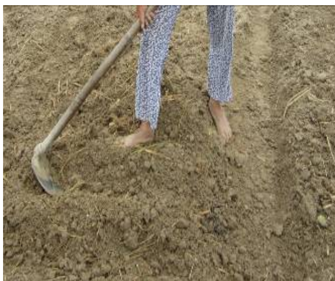
Hình 1.2. Rạch hàng trồng đậu tương

Bề mặt luống rộng 1,2 m, rãnh rộng 30 - 40 cm, sâu 20 - 25 cm. Dùng đòn gánh hoặc thanh gỗ nặng hình tam giác chêm ngang luống hoặc dùng cuốc tạo thành rạch ngang sâu 2 - 3 cm, rạch cách nhau 30 cm. Tra hạt theo hốc 2 - 3 hạt với khoảng cách hốc cách hốc 7 - 12 cm. Dùng số hạt thừa khoảng 100 gr, nên gieo thêm 1 m 2 mạ ở đầu bờ để dặm sau 5 - 7 ngày khi gieo (khi cây con chưa có lá thật) dặm vào các chỗ khuyết mật độ.