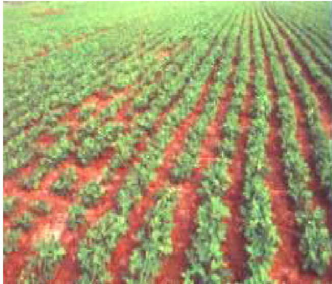
Hình 1.6: Trồng lạc theo băng

Để thoát nước tốt cũng như tưới khi cần thiết và sử dụng nguyên lý hiệu ứng hàng rìa, tốt nhất nên làm luống rộng 0,6m, rãnh 0,3m. Rãnh cao 10-12cm. Gieo hai hàng dọc luống cách mép luống 10-15cm, khoảng cách: hốc x hốc =