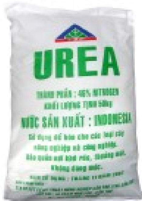
Hình 1.10. Phân đạm ure Indonesia

Nitrogen: 46% tối thiểu. Độ ẩm 0,5% tối đa. Kích cỡ hạt: 90% tối thiểu (0,85 – 2,8mm). Trọng lượng: 50 kg. màu trắng đục, chảy đều, không ẩm ướt và không có chất gây hại. Hàng được đóng trong bao PE và bao PP bên ngoài