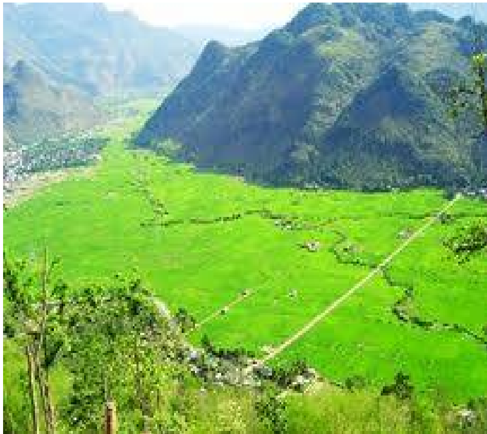
Hình 1.1. Vùng núi Tây Bắc

Vùng tây Bắc có khí hậu núi cao là chủ yếu. Do dãy Hoàng Liên Sơn che khuất nên mùa đông tần suất Frông lạnh ít hơn và ấm hơn Đông Bắc, mưa phùn ít hơn( trừ Hoà Bình, Mộc Châu). Hệ sinh thái nông nghiệp chính của vùng là cây công nghiệp, cây ăn quả nhiệt đới và chăn nuôi đại gia súc.