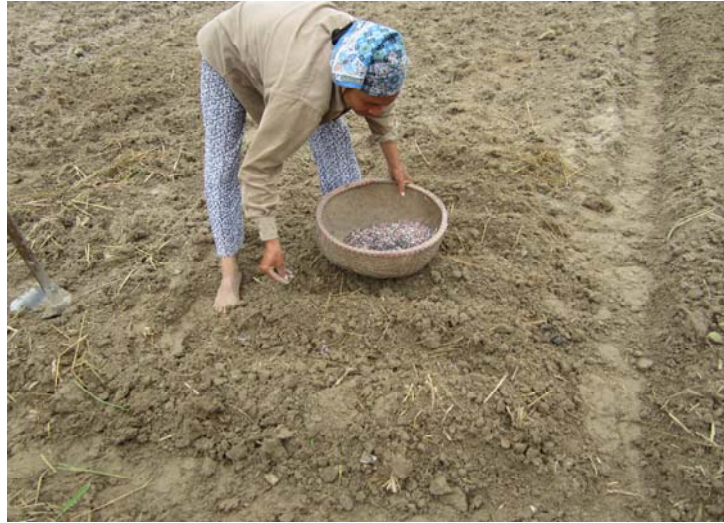
Hình 1.21. Bón phân lót cho đậu tương

Bón lót tạo điều kiện cho cây sinh trưởng sớm với tốc độ nhanh ngay trong giai đoạn đầu của quá trình sinh trưởng, tạo đà cho cây phát triển tốt. Chính vì vậy bón lót giữ vai trò quan trọng là khâu kỹ thuật không thể thiếu được khi bà con trồng đậu tương. Công việc bón phân lót cho đậu tương bao gồm các bước sau: