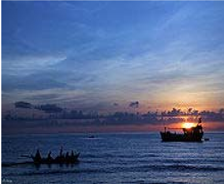
Hình 1.6. Vùng duyên hải nam Trung Bộ

đông. Gió mùa Đông Bắc thổi đến đây thường bị suy yếu và bị chặn lại bởi dãy Bạch Mã ít ảnh hưởng tới các vùng phía Nam.