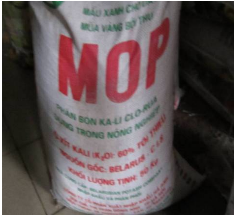
Hình 1.14. Phân kali clorua

Hoà tan mạnh trong nước. Khi để khô có độ rời tốt, dễ bón. Nhưng khi hút ẩm kết dính lại thành dạng dính bột khó sử dụng