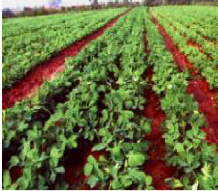
Hình 1.5: Trồng lạc theo hàng