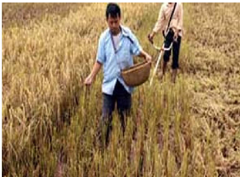
Hình 1.3: Gieo vãi đậu tương

- Gieo vãi: Vãi đều hạt trên mặt luống đảm bảo mật độ 45-50 cây/m 2 . Sau đó dùng liềm cắt sát góc rạ để phủ kín hạt cho hạt nảy mầm được thuận lợi. Phương pháp gieo hạt này nhanh nhưng dễ bị trôi hạt nếu như gặp mưa to sau khi gieo.