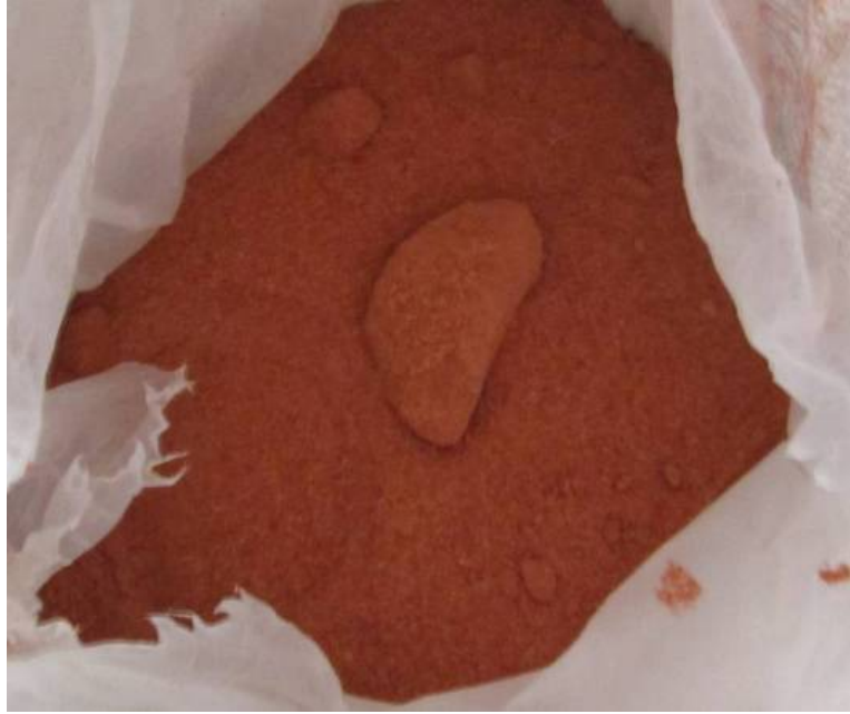
Hình 1.15 . Phân clorua kali đỏ

Không nên dùng bón cho đất mặn là loại đất chứa nhiều clo. Clorua kali rất thích hợp với một số loại cây như cây dứa (vì dứa là cây ưa clo). Nhưng không nên dùng loại phân này bón cho các loại cây như thuốc lá (kỵ clo), không nên bón cho chè, cà phê, vì phân ảnh hưởng đến phẩm chất nông sản (làm giảm hương vị)