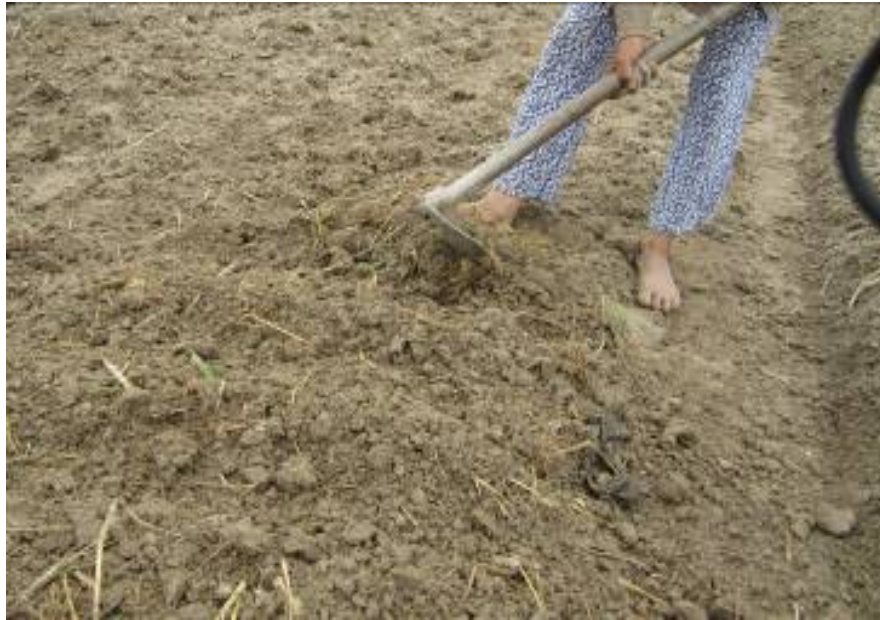
Hình 1.7: Rạch hàng bỏ hốc trồng lạc

13-15 cm, mỗi hốc 2 hạt. Nếu đất cát pha thoát nước tốt có thể làm luống rộng 1m, rãnh 0,3m, rãnh cao 7-10cm. Gieo 4 hàng dọc luống khoảng cách: Hốc x hốc = 18-20 cm/hốc, mỗi hốc 2 hạt