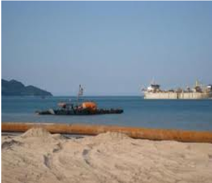
Hình 1.5. Vùng đông Bắc Bộ

là gió Lào) tràn ngược lên, thường gây ra thời tiết khô nóng với nhiệt độ ngày có khi lên tới trên 40 0 C, trong khi đó độ ẩm không khí lại rất thấp.