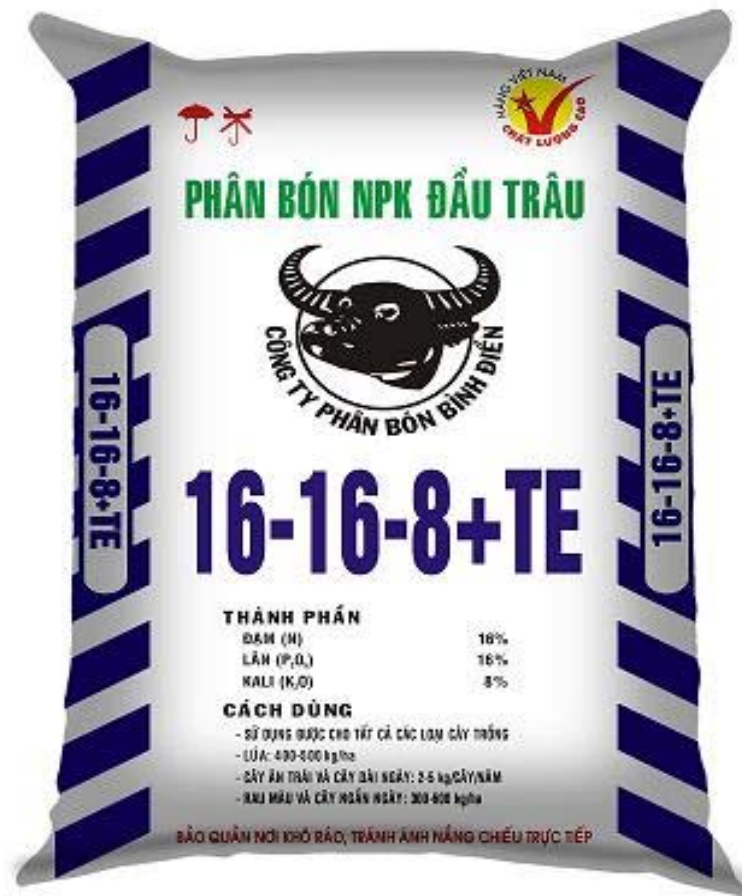
Hình 1.17. Phân bón hỗn hợp đầu trâu

Tùy theo yêu cầu của cây và đặc tính của đất, người nông dân có thể mua loại phân thích hợp để bón.