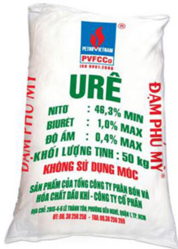
Hình 1.11. Phân đạm ure Phú Mỹ

Thích hợp với mọi loại cây trồng và mọi loại đất. Đạm Phú Mỹ sử dụng thích hợp cho tất cả các loại cây trồng trên các vùng đất khác nhau.