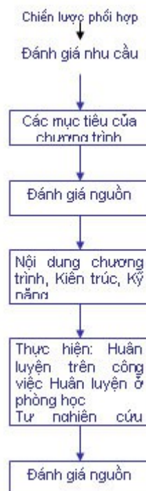
Hình 7-3. Chương trình đào tạo

Theo yêu cầu thực hiện có kết quả một chương trình có hiệu quả, mỗi bước cần hoàn thành trong cách của nó và đối với bước tiếp theo nó là bước khởi đầu. Mặc dù trong hình 7-3 không chỉ ra, ở đây có nhiều trường hợp khi thông tin được thực hiện ở một bước có thể đòi hỏi rằng kết quả ở một bước trước cần thẩm định lại. Phần còn lại của chương này sẽ giải thích các thành phần của quá trình này.