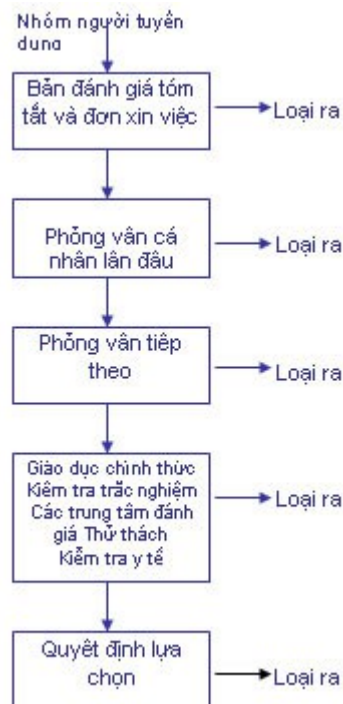
H 7-1. Quá trình lựa chọn

Quá trình lựa chọn cũng cần được xem xét như một quá trình có thời kỳ. Phần lớn các phương pháp thường được áp dụng là kết hợp bản tóm tắt với phỏng vấn người xin việc, kiểm tra giấy giới thiệu và phỏng vấn cá nhân bởi nhiều người ở hãng. Một số hoạt động trong quá trình lựa chọn tốn nhiều hơn những cái khác. Nguyên tắc chủ đạo là áp dụng chi phí thấp nhất nhưng theo tiêu chuẩn cho số tuyển dụng lớn nhất và chi phí cao nhất cho số nhỏ nhất. Hình 7-1. mô tả quá trình lựa chọn năm bước bằng phối hợp các công cụ đã mô tả trước đó.