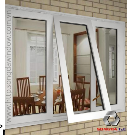
b. Cửa sổ mở hất ra ngoài