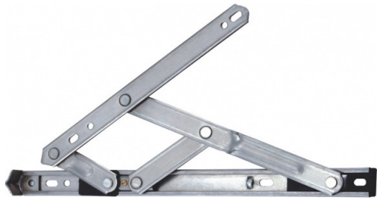
Bản lề chữ A