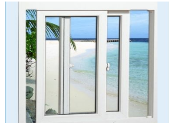
d. Cửa sổ trượt