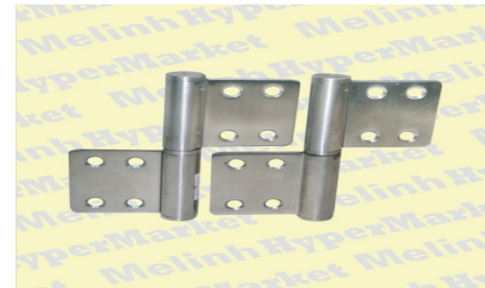
Bản lề thường