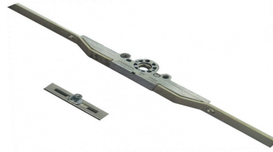
Chốt đa điểm