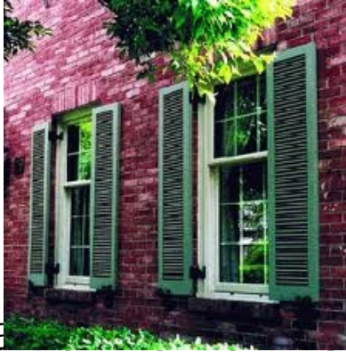
a. Cửa ngang