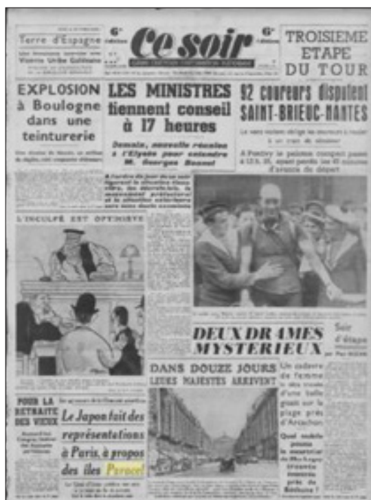
Báo Ce soir , số 492, ngày 08/7/1938 tại Paris có đăng bài: “Nhật Bản trình đại diện ngoại giao ở Paris về vấn đề quần đảo Hoàng Sa”, trang 1 và 5.

là “sự chiếm đóng”, đặc biệt là quần đảo này lại thuộc chủ quyền của vương quốc An Nam. Mặt khác, Nhật Bản không có chủ quyền đối với quần đảo Hoàng Sa, và họ có một sự táo bạo nhất định trong yêu sách của mình, xuất phát từ một quốc gia không có tuyên bố chiến tranh, nhưng chỉ một năm trước đây, đã bắt đầu cuộc chinh phục dã man Trung Quốc”. (43)