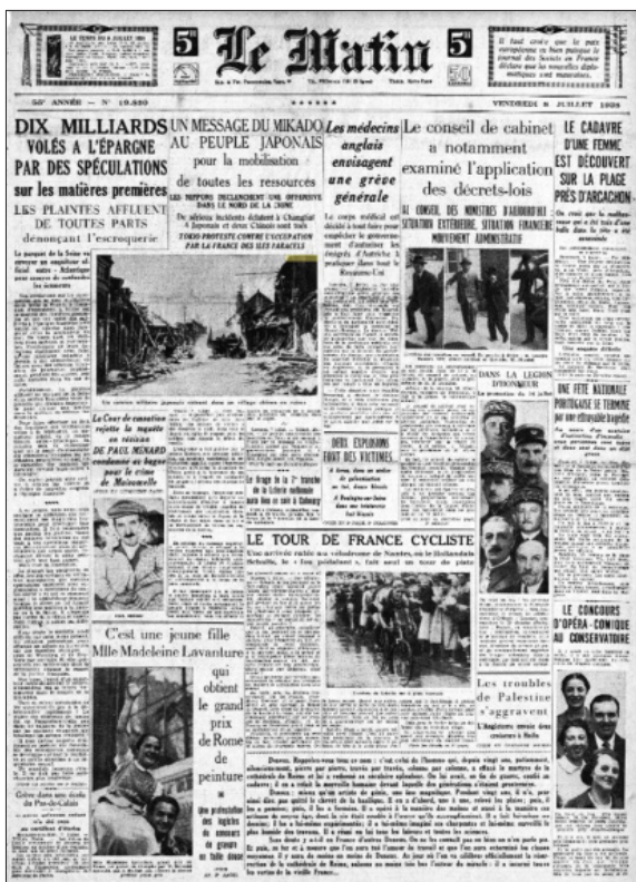
Báo Le Matin , số 19830, ngày 08/7/1938 tại Paris có đăng bài: “Tokyo kháng nghị việc Pháp chiếm đóng quần đảo Hoàng Sa”, trang 1 và 3.

Thứ trưởng Bộ Ngoại giao [Nhật] rằng chính phủ Đông Dương thuộc Pháp đã bổ nhiệm một viên chức quản lý cho quần đảo Hoàng Sa. Ông nói thêm rằng lợi ích của các đối tượng mà Nhật Bản đã khai thác là tảo biển và phosphat ở các đảo trong hơn một thập niên sẽ được tôn trọng”. (50)