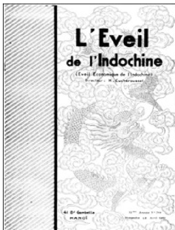
Báo L'Eveil de l'Indochine ( L'Eveil économique de l'Indochine ), số 785, ngày 23/4/1933 tại Hà Nội có đăng bài: “Phosphat trên quần đảo Hoàng Sa”, trang 7-15.

Cũng trong năm 1927, Pháp cho đặt một trạm khí tượng hạng nhất tại đảo Hoàng Sa và một trạm phong vũ biểu tại đảo Ba Bình ở Trường Sa. Đây là hai đài khí tượng nằm trong hệ thống được quốc tế thừa nhận. Tiếp đó, Pháp lại đưa tàu De Lanessan tiến hành cuộc khảo sát khoa học trên quần đảo Trường Sa vào năm 1927, và tháng 11/1928, Thống đốc Nam Kỳ cấp giấy phép nghiên cứu mỏ ở quần đảo Trường Sa cho Công ty Phosphat Bắc Kỳ Mới. Năm 1929, sứ bộ Perrier de Rouville đề nghị xây dựng bốn đèn pha ở bốn góc quần đảo Hoàng Sa (trên các đảo