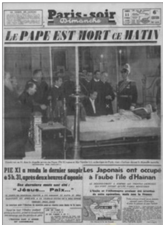
Báo Paris-soir , số 163, ngày 11/02/1939 tại Paris có đăng bài: “Người Nhật chiếm đóng bước đầu đảo Hải Nam”, trang 1 và 6.

chúng ta có may mắn để thu thập từ phát ngôn của một nhân chứng, mà chúng ta nhắc lại ngày hôm nay”. (62)