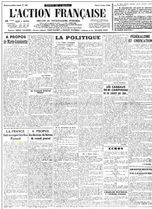
Báo L'Action française , số 186, ngày 05/7/1938 tại Paris có đăng bài: “Pháp chiếm đóng quần đảo Hoàng Sa” trên trang nhất.