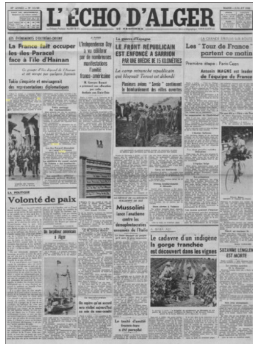
Báo L'Echo d'Alger , số 10195, ngày 05/7/1938 tại Alger (Algérie) có đăng bài: “Pháp chiếm đóng quần đảo Hoàng Sa đổi diện đảo Hải Nam - Những đảo này thuộc chủ quyền An Nam và bị một số người Nhật chiếm dụng” trên trang nhất.

Tương tự, báo Affaires étrangères cũng đưa tin ngày 04/7/1938 với nội dung: “Để đảm bảo an toàn hàng hải quanh vùng biển quần đảo Hoàng Sa, chính phủ Đông Dương đã bố trí đội lính bảo an người An Nam ở đó”. (37) Còn báo Journal officiel de la Guyane française ở Nam Mỹ ngày 09/7/1938 có bài viết mang tính tổng thuật vấn đề: “Chúng ta biết rằng tuần trước, chính phủ Anh đã được thông báo về sự chung sức Pháp-Anh trong các sự kiện liên quan đến khu vực Nam Trung Quốc, đặc biệt là chống lại mối đe dọa của Nhật Bản chiếm đảo Hải Nam đối diện với Đông Dương. Một công văn từ London nói rằng chính phủ Pháp thông báo cho chính phủ Anh về việc chiếm đóng quần đảo Hoàng Sa của Pháp ở phía đông-nam đảo Hải Nam. Tokyo tuyên bố chính phủ Nhật Bản đang theo dõi tình hình một cách chặt chẽ. Các tờ báo Pháp nói nước Pháp đã có một thế kỷ coi quần đảo Hoàng Sa là một phần của chủ quyền của An Nam. Trong thời gian gần đây, chính phủ Đông Dương đã xây các ngọn hải đăng, đài vô tuyến T. S. F và các trạm khí tượng được lắp đặt. Để thực hiện việc giám sát các công trình này, chính phủ Đông Dương gửi đến hai hòn đảo này phân đội lính bảo an [của An Nam] thông qua một tàu thương mại. Người được ủy quyền [của Bộ Ngoại giao Pháp] nói rằng điều này không thể được coi là đồ bộ quân sự”. (38)