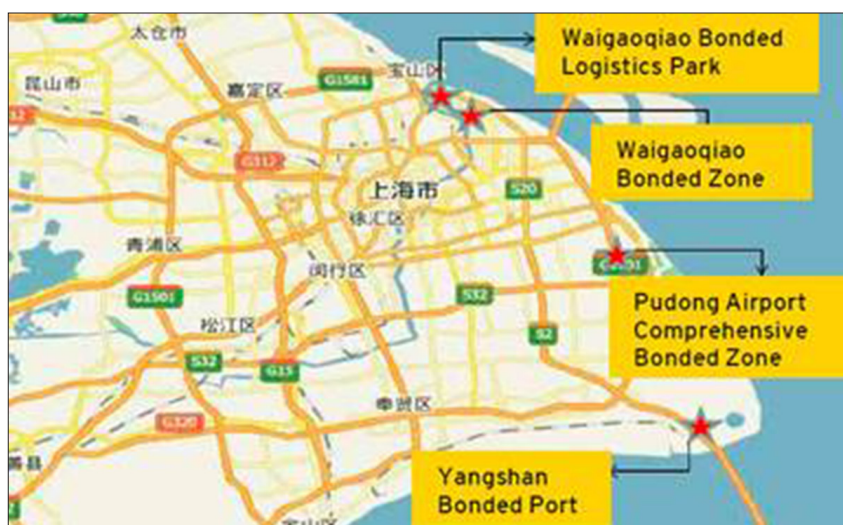
Hình 1. Khu Mậu dịch Tự do Thượng Hải