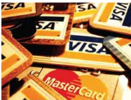
Thẻ tín dụng