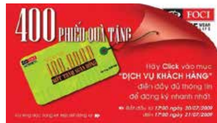
Phiếu quà tặng