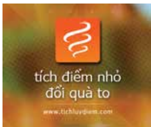
Thẻ tích lũy điểm của khách hàng