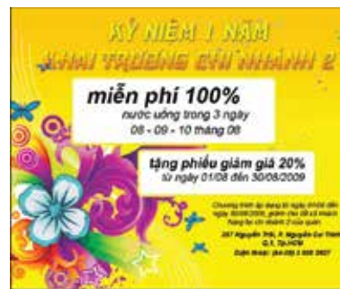
Phiếu giảm giá