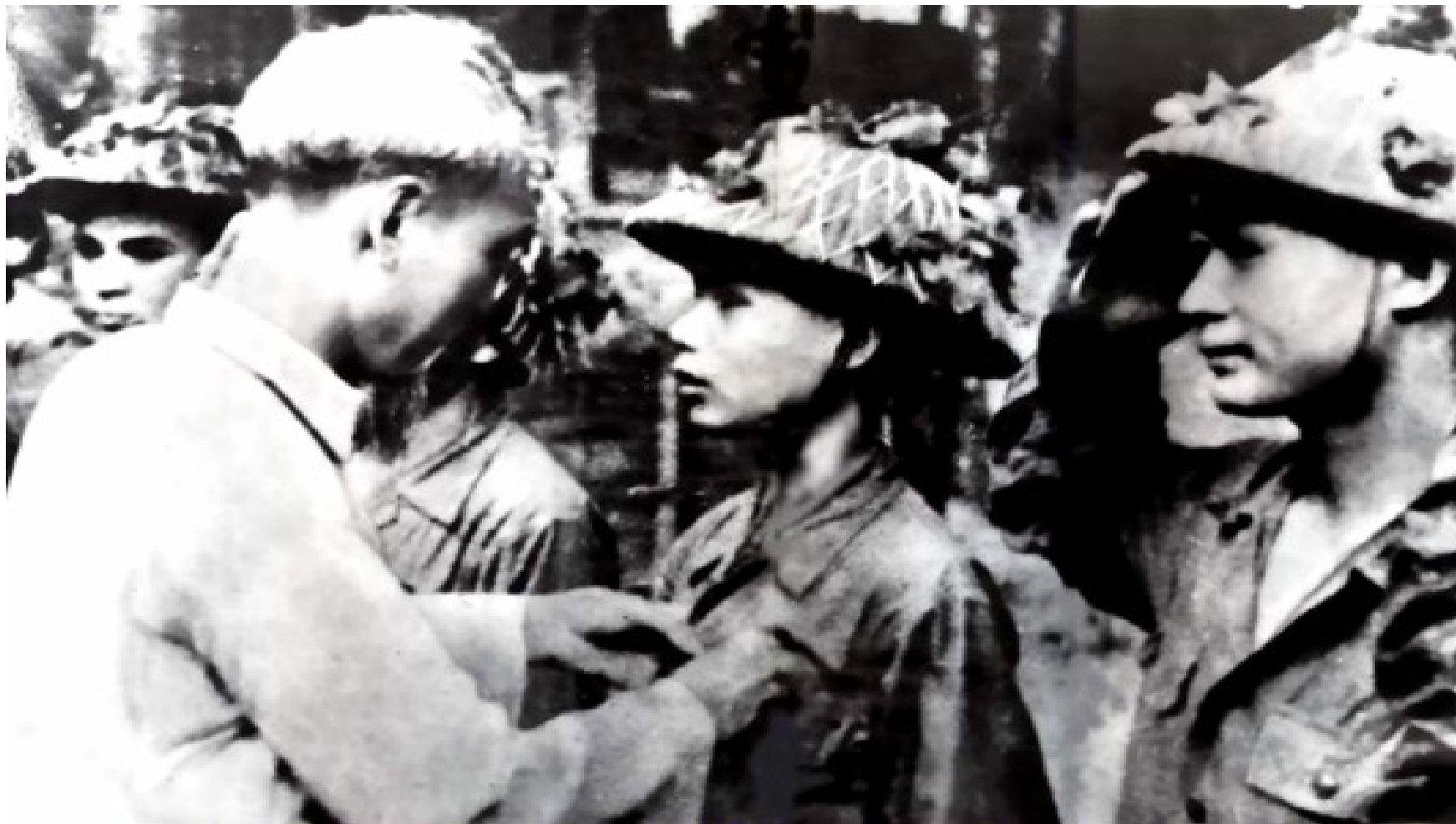
Bác Hồ khen tặng các chiến sĩ thắng trận Điện Biên Phủ