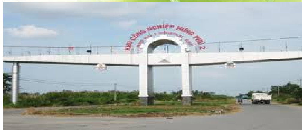
KCN Hưng Phú