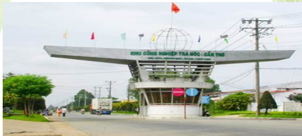
KCN Trà Nóc

Để đáp ứng nhu cầu của các nhà đầu tư, bên cạnh nỗ lực cải cách thủ tục hành chính, áp dụng cơ chế hỗ trợ đầu tư, TP.Cần Thơ đã và đang tích cực đẩy nhanh tiến độ xây dựng các khu công nghiệp (KCN) tập trung và coi đây là trọng điểm thu hút đầu tư, tạo động lực phát triển kinh tế - xã hội, góp phần đưa TP.Cần Thơ trở thành thành phố công nghiệp trước năm 2020