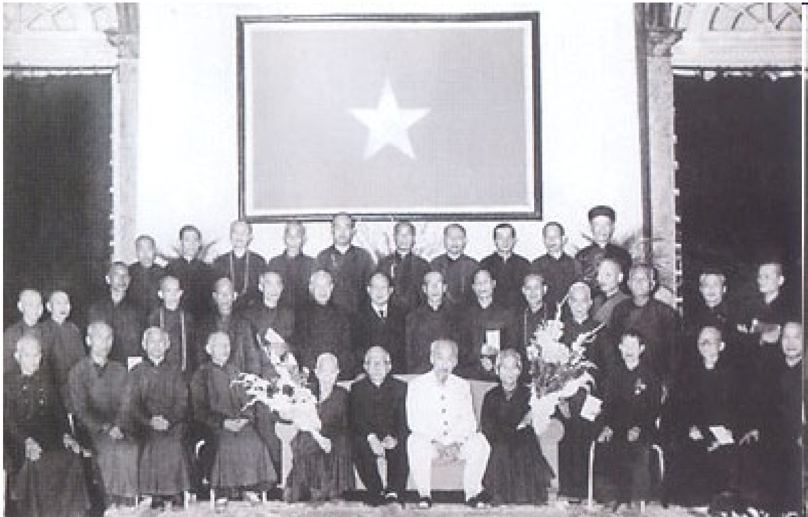
Bác Hồ với các đại biểu Hội Phật giáo Việt Nam, ngày 03/01/1957