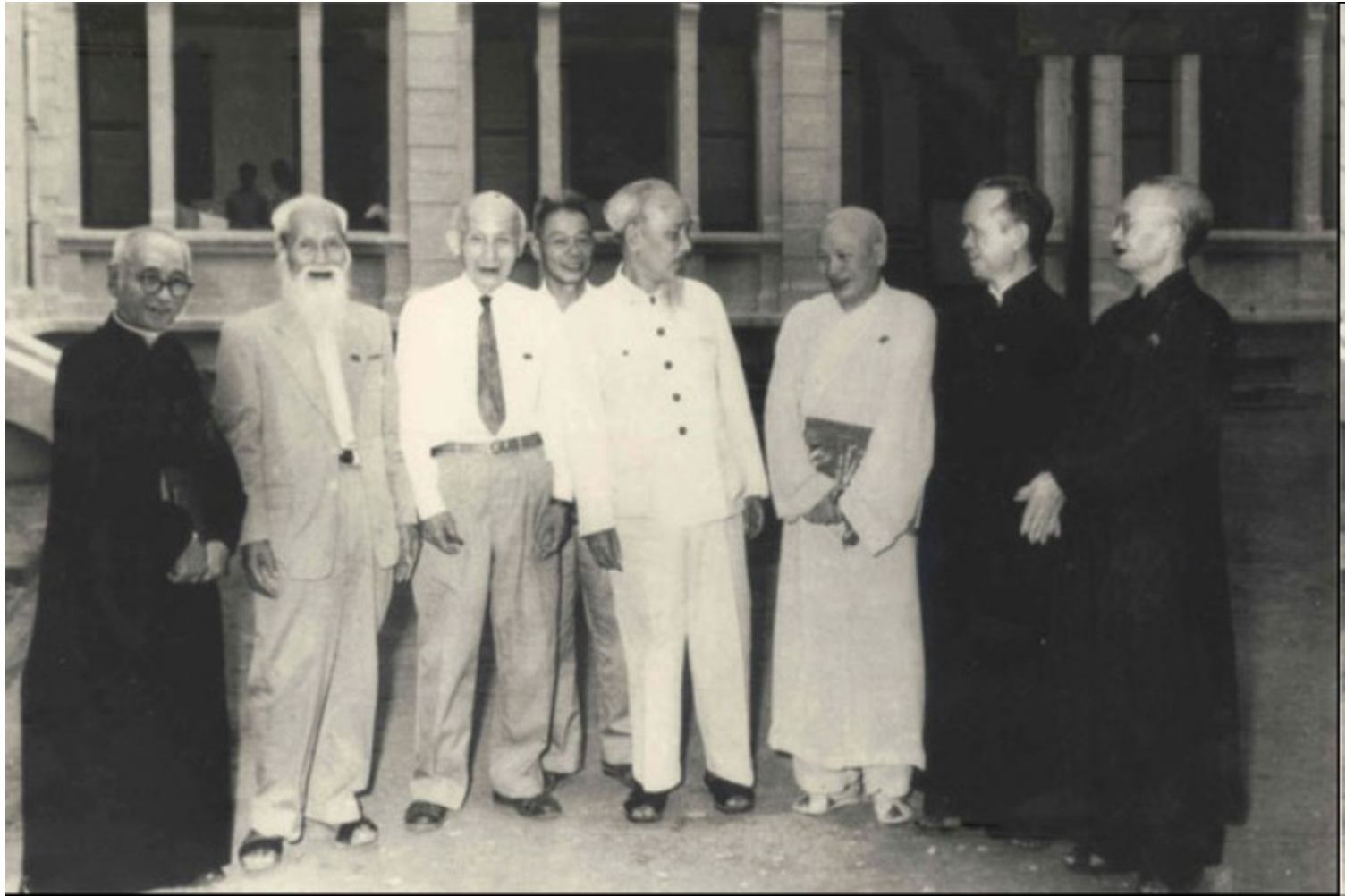
Chủ tịch Hồ Chí Minh nói chuyện với các đại biểu tôn giáo trong Quốc hội nước Việt Nam Dân chủ Cộng hòa năm 1960